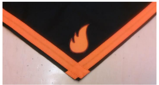
Huivi ja huivimerkki

Paidan oikeaan hihaan ommellaan ylös seikkailijan aloitusmerkki (kompassiruusu) ja sen ympärille ilmansuunnat. Niiden alle ommellaan kolmen riveihin taitomerkit, väli-ilmansuunnat ja joulukampanjan merkit saantijärjestyksessä. Niiden alle siirretään vanhemmat tapahtumamerkit.