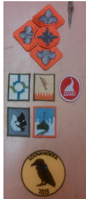
Esimerkki ilmansuuntien, taitomerkkien ja tapahtumamerkkien asettelusta oikeaan hihaan