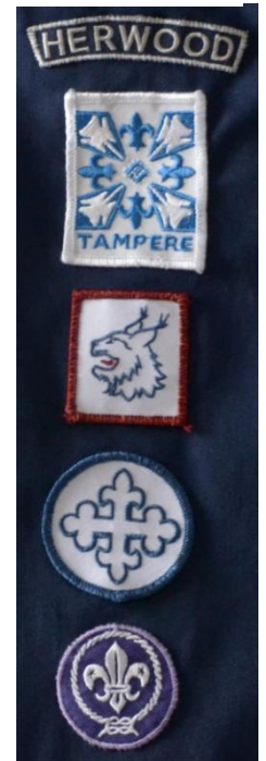
Vasemman hihan merkit