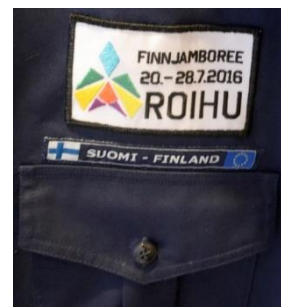
Maatunnus ja viimeisin tapahtumamerkki oikean rintataskun yllä